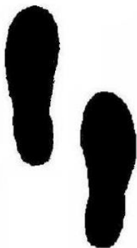
2 paveikslas. „Stovėjimas suglaustomis kojomis ir viena koja puse pėdos pastatyta į priekį“.