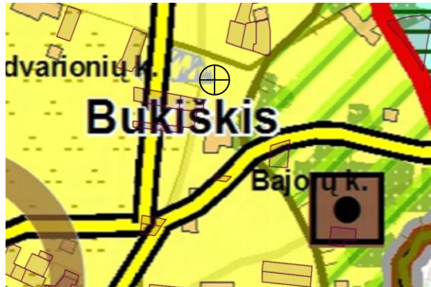
2 pav. Ištrauka iš Vilniaus rajono savivaldybės teritorijos bendrojo plano „Žemės naudojimas ir reglamentai“