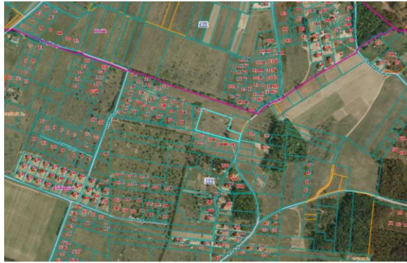
1 pav. Ištrauka iš VĮ Registrų centro kadastro žemėlapis