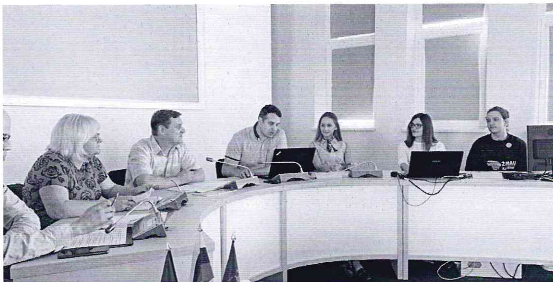
Pirmasis Prienų JRT posėdis vyko 2019 m. liepos 19 d.

2019 metais vyko 3 Prienų JRT posėdžiai. Prienų JRT patvirtino veiklos kryptis pagal kurias planavo savo posėdžius.