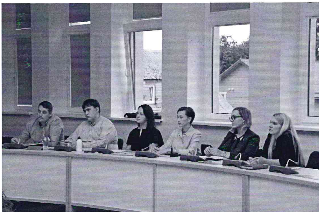
Antrasis Prienų JRT posėdis vyko 2019 m. rugsėjo 13 d.