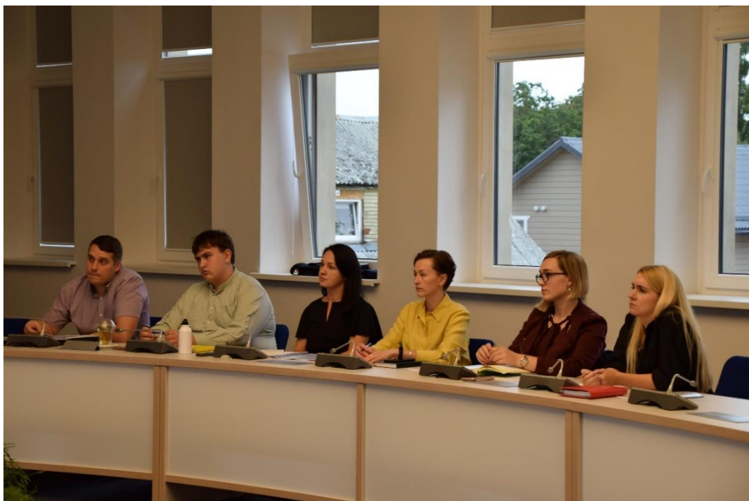
Antrasis Prienų JRT posėdis vyko 2019 m. rugsėjo 13 d.