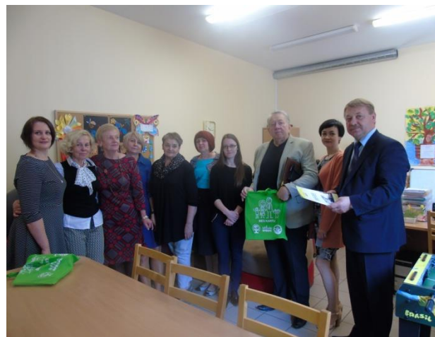
Domėtasi Radviliškio parapijos bendruomenės socialinių paslaugų centro Paramos šeimai tarnybos, Vaikų dienos centro ir Krizių centro veikla

• Investicijų ir kaimo plėtros komitetas 2017 m. nesuorganizavo nei vieno išvažiuojamojo komiteto posėdžio. Eiliniuose komiteto posėdžiuose buvo svarstomi Radviliškio rajono savivaldybės tarybai pateikti klausimai.