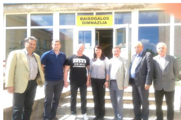
Domėtasi Baisogalos gimnazijos veikla, gimnazijos pastato būkle, atnaujinimo galimybėmis