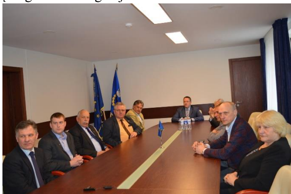
Susitikime su Palangos miesto tarybos nariais

✓ 2018 metų Radviliškio rajono savivaldybės biudžete numatyti lėšų Baisogalos priestočio bendruomenės „Imantai“ pastato unikalios technologijos sienų remontui ir vaizdo stebėjimo kamerų įrengimui Baisogaloje.