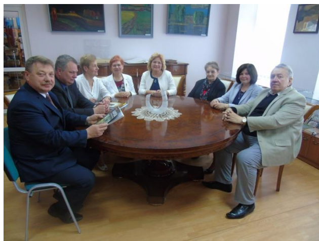
Radviliškio rajono savivaldybės viešajoje bibliotekoje