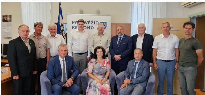
Panevėžio regiono plėtros tarybos kolegijos nariai

Panevėžio regiono plėtros taryba – tai pelno nesiekiantis ribotos civilinės atsakomybės viešasis juridinis asmuo, kurio tikslai yra: planuoti, koordinuoti nacionalinės regioninės politikos įgyvendinimą Panevėžio regione ir bendrai su kitomis regionų plėtros tarybomis, savivaldybių institucijomis ir įstaigomis įgyvendinamas regioninės plėtros skatinimo priemonės; skatinti socialinę, ekonominę Panevėžio regiono plėtrą, darnų urbanizuotų teritorijų vystymą, socialinių ir ekonominių skirtumų tarp Panevėžio regiono ir kitų regionų bei šių skirtumų tarp Panevėžio regiono savivaldybių mažinimą; skatinti savivaldybių bendradarbiavimą, siekiant padidinti funkcinių zonų vystymo ir viešųjų paslaugų teikimo organizavimo efektyvumą; atstovauti Panevėžio regionui.