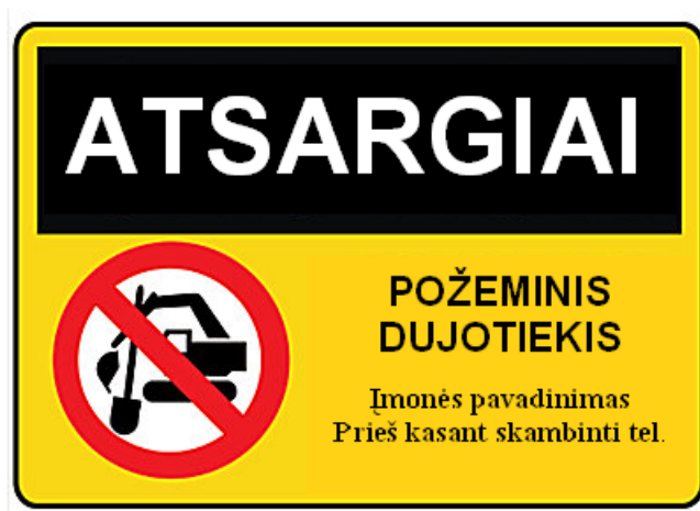
2 paveikslas. Informacinio ženklo pavyzdys